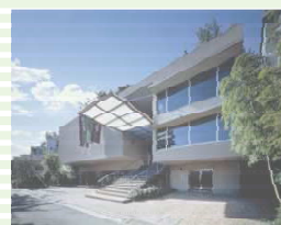
STEP 創立 85 周年記念館