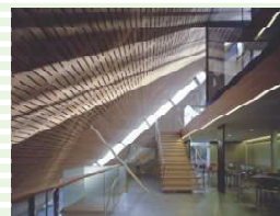
RISE 創立 100 周年記念館