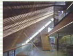
RISE 創立 100 周年記念館