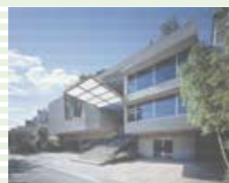
STEP 創立 85 周年記念館

〒561-0872 大阪府豊中市寺内 1-1-43 TEL : 06-6866-0800 http://www.chuoko-osaka.ac.jp/