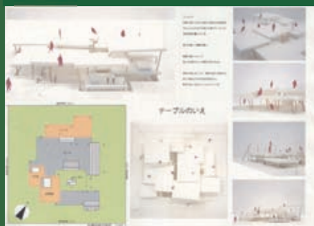
テーブルのいえ 富山県立富山工業高等学校 1学年 長尾 柊人