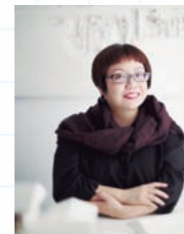
東 利恵 (建築家)