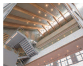
2・3号館 創立110周年記念