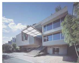
STEP 創立 85 周年記念館

〒561-0872 大阪府豊中市寺内 1-1-43 TEL : 06-6866-0800 http://www.chuoko-osaka.ac.jp/