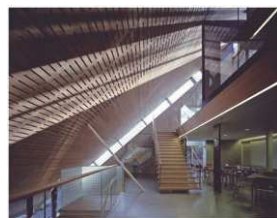
RISE 創立 100 周年記念館