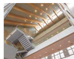
2・3号館 創立110周年記念