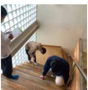
建築意匠(階段の実測)

1年後期から2年前期に履修する建築意匠では、建築物の要素に関する知識を学びます。日常的に使用する階段やトイレなどを実測し、調査・研究を行い、演習課題を通して計画・設計の方法を身につけます。理論・理想だけではなく、本物から得られる体験を設計に活かし、表現方法を学ぶことができます。