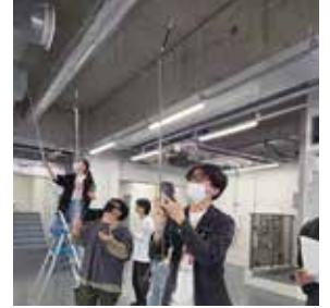
建築環境測定(風量測定)

図面で描くことができたとしても、実際に現場で施工することができなければ意味がありません。設備施工図では作図だけではなく、配管加工実習などを通して、現場作業を体験することで、作業手順や施工性の良し悪しなどを学びます。