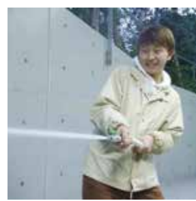
放水体験(2号消火栓)