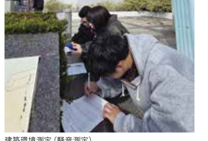
建築環境測定(騒音測定)