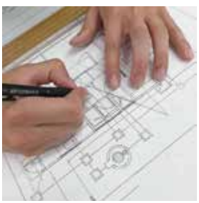
建築設計製図(木造住宅設備演習)

初めに建築物の構造や施工方法など建築の仕組みを学びます。1年次は建築の基本から学習し、建築設備との関係を学ぶことができるカリキュラムになっています。特に建築設備実習室では建築・設備の図面と実物を見比べながら、構造体や設備システム、図面表現などを身につけることができます。