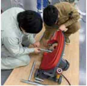
設備施工図(配管加工実習)