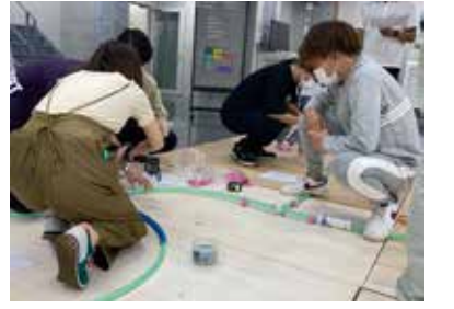
設備施工図(樹脂管施工実習)