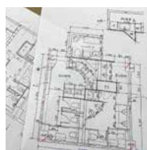
建築意匠(トイレ設計)